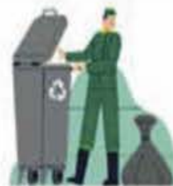
RESIDUOS Y LIMPIEZA

Tod@s l@s vecin@s tenemos la responsabilidad y el deber de cuidar el medio ambiente, hacer lo posible para frenar el cambio climático, la desertización y el deterioro de nuestro territorio, así como los riesgos para la salud que la contaminación conlleva.