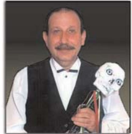
En esta obra se llama Poncellina y deberá enfrentarse a numerosas situaciones.

El día 10 a las 12:00 horas, representación de la obra de teatro "El viajero perdido". Y el 19, actuación de títeres "La Cenicienta (tal vez sí, tal vez no)", en la que se descubrirá la verdadera historia de la Cenicienta.